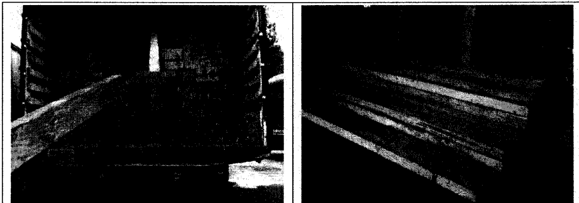
Fotografías 3 y 4. Piezas de madera incautada